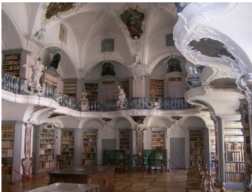
Blick in den Saal der Rokokobibliothek St. Peter i. Schwarzwald