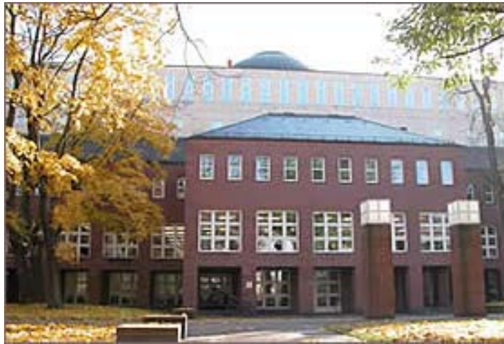
Badische Landesbibliothek Karlsruhe

Ab 2004 fanden mehrere Arbeitstreffen in der UB Freiburg statt. Dank einer energiegelichen und vollständig von Freiburg getragenen Projektorganisation, entstand eine sehr gut funktionierende Internet-Applikation 1 , welche heute historische Karten aus mehreren EUCOR- Bibliotheken, aber auch Drucke und historische Ansichten zugänglich macht. Neben den UBs Freiburg und Basel wurden die Badische Landesbibliothek, die B.N.U.S., die Université Louis Pasteur sowie das Badische Generallandesarchiv als externer Projektpartner gewonnen.