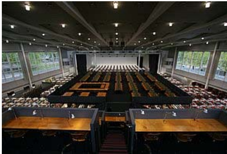
Blick von der Empore der UB 1 auf das neue Podest mit Arbeitsplätzen sowie auf den Lesesaal

Seit Dezember 2008 existiert in der ehemaligen Gaststätte „Freiburg Bar“ eine vom Studentenwerk betriebene Cafeteria mit Bewirtschaftung tagsüber und mit Automatencafé während der Nachtstunden und an Wochenenden sowie an Feiertagen. Dort befinden sich zudem Gruppenarbeitsplätze, die ohne Verzehrzwang nutzbar sind. Der Zugang zur Cafeteria erfolgt innerhalb der Stadthalle, jedoch ist es nur gestattet, verschlossene Flaschen mit Wasser in die Bibliotheksräume mitzunehmen, nicht aber sonstige Getränke oder Speisen.