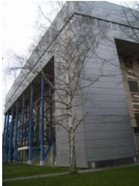
Bibliothèque de Sciences et Technique (Strasbourg)

Allerdings begann in Straßburg ab Januar 2007 der Prozess einer Vereinigung dieser drei SDC's zu einem gemeinsamen "Service Inter-Etablissement de Cooperation Documentaire (SICD)". Kern des neuen gemeinsamen bibliothekarischen Dienstleistungsangebots ist ein gemeinsames Portal, das sich in Vorbereitung befindet.