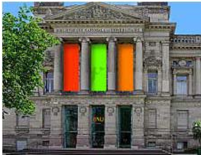
Bibliothèque nationale et universitaire de Strasbourg (B.N.U.S.)

Die ersten konkreten Absprachen und Vereinbarungen Anfang der 90er Jahre führten zur Gründung (eines Sekretariats) einer Koordinierungsstelle der EUCOR-Bibliotheken, die an der UB Freiburg angesiedelt und von ihr bis heute getragen wird. Von der Koordinierungsstelle wurde nicht lange nach deren Gründung ein Bibliotheksführer, zunächst in Form eines Faltblattes, erstellt. Dieser Bibliotheksführer ist heute online im Internet zugänglich 1 . Bereits ab dem Jahr 1992 erschienen die EUCOR-Bibliotheksinformationen / EUCOR informations des bibliothèques 2 - mit in der Regel zwei Ausgaben pro Jahr 3 . Die EUCOR-Bibliotheksinformationen enthielten regelmäßig die Protokolle der EUCOR-Sitzungen, sofern solche stattfanden. Die Berichte waren größtenteils auf Deutsch, gelegentlich auch auf Französisch abgefasst.