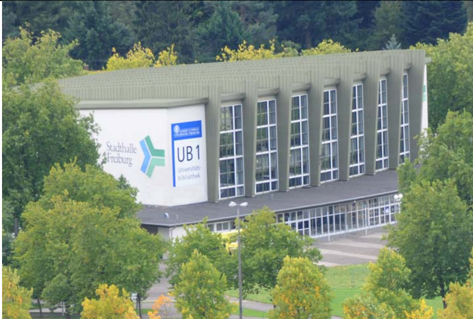
Gebäude der UB 1 in der Stadthalle am Alten Messplatz