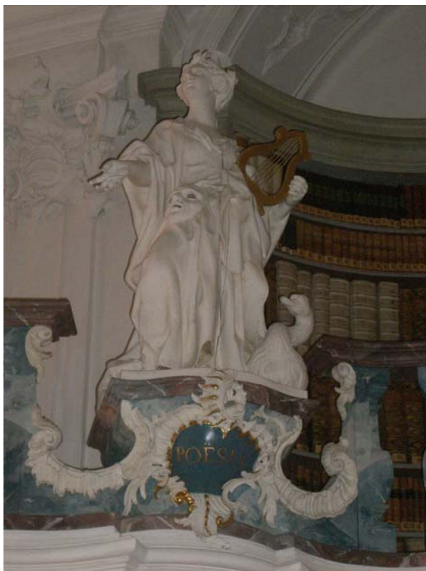
Klosterbibliothek St. Peter: Darstellung der Poesie

rische Erschließung war zudem auf hervorragendem Stand, wie der heute in der UB Freiburg befindliche Katalog erkennen lässt.